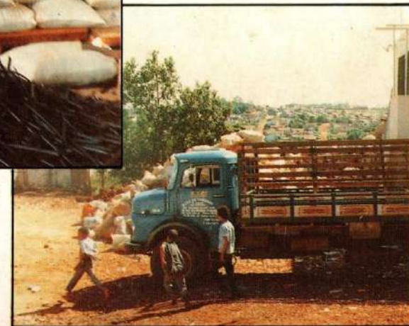
Plástico usado para a reciclagem