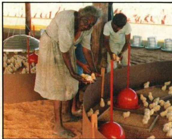
Granja na Fazenda Badajós, outra fonte de trabalho, de terapia e de recursos alimentícios.