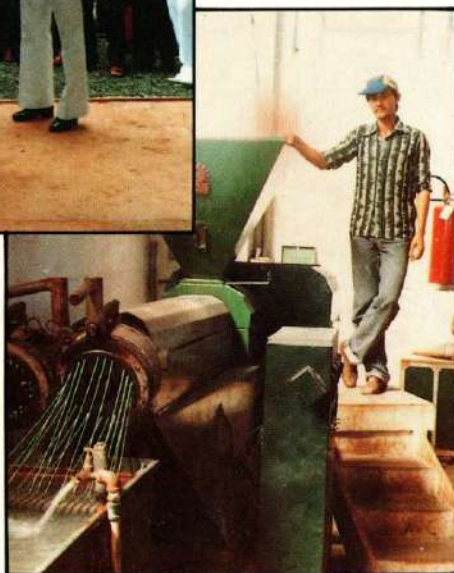
Industrialização do plástico recuperado