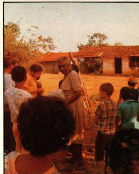
Fazenda Badajós, na periferia de Uberaba, onde as crianças em tratamento encontram oportunidade de serem úteis.