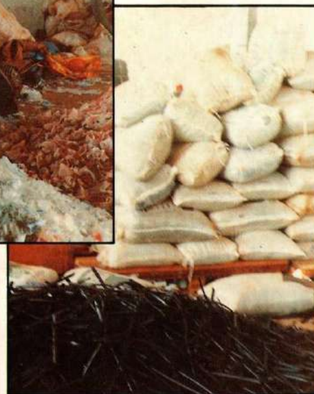
Produtos de plástico industrializados pelo Lar da Caridade