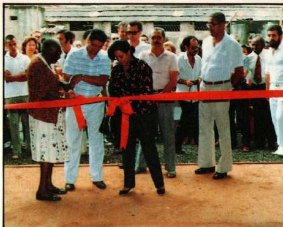
Inauguração da Indústria do Plástico vendo-se autoridades uberabenses e amigos