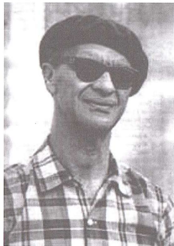
Chico usando boina, satisfazendo o seu gosto pessoal.