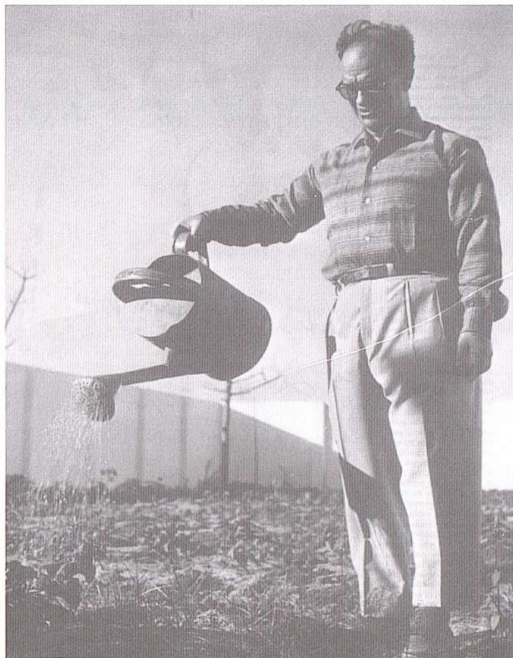
Chico aguando horta.